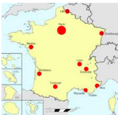
Carte des aires urbaines françaises

Ce sont les métropoles de l'Ouest et du Sud qui observent une croissance plus forte, du fait de conditions de vie jugées comme étant plus agréables. Après avoir connu un fort essor, les centres subissent une baisse de leur croissance, causée par la cherté et la rareté des logements.